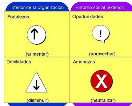
Diagrama 1. Modelo DOFA.

A su vez deben calcular los siguientes indicadores: